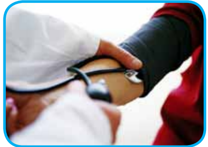
کاهش مصرف نمک، مقرون به صرفه ترین راه حل کاهش فشار خون است

◀ تجربه کشورهای موفق نشان می دهد با کاهش مصرف نمک در جامعه، هزینه های درمانی کاهش قابل توجهی یافته است.